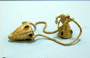
Сочи́нский худо́жественный музей