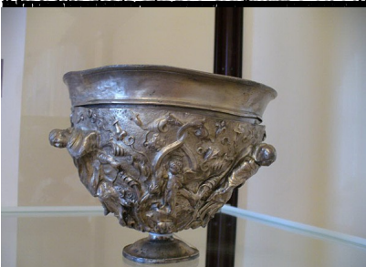
Серебряный сосуд, найденный в руинах древней крепости в долине реки Псекупс, окрестности Сочи.