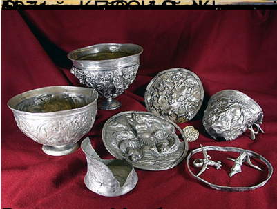
Варяжские серебряные сосуды, найденные в руинах древней крепости в долине реки Псекупс, окрестности Сочи.